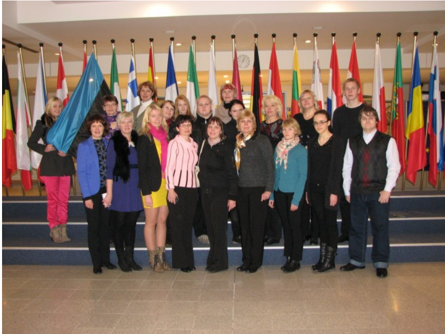
Foto 1. Kanepi Gümnaasiumi õpilased ja õpetajad Euroopa Parlamendis lippude taustal (2013) 2